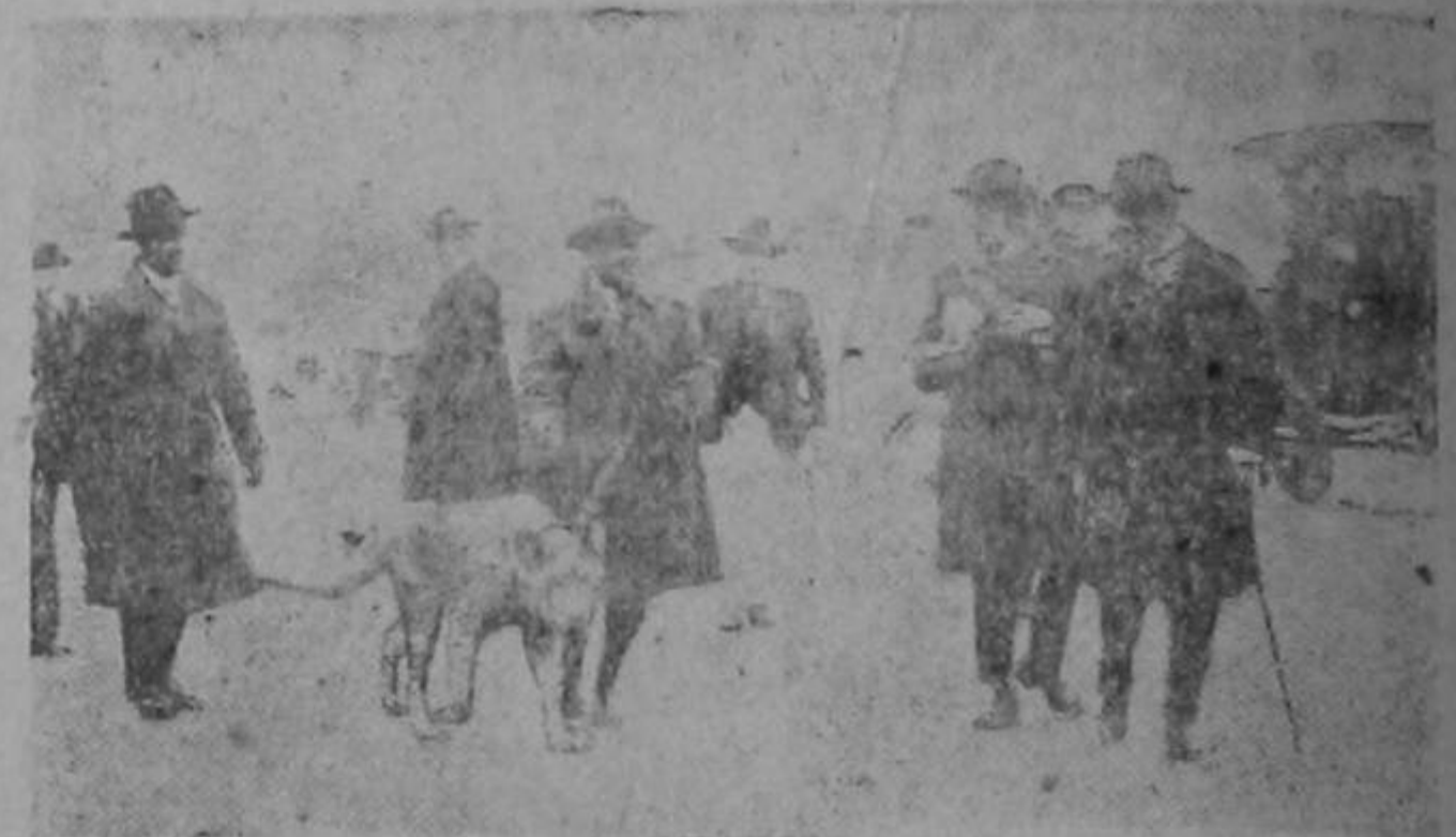
PARIS.—Los bulevares se han visto transitados por un personaje que no pasa frecuentemente por allí. Se trata de una magnífica leona de un circo, que ha hecho acompañada por su domador y lo más tranquila del mundo un paseo exigido por la publicidad.

Entre sus célebres prelados cuenta la iglesia a este Santo, nacido en el territorio de Ravena, de padres muy cristianos, que le educaron en el santo temor de Dios. El obispo de la ciudad le admitió en su servicio, y le ordenó de sacerdote, en cuyo elevado ministerio manifestó las más relevantes prendas en beneficio de sus diocesanos y en honor de la Iglesia. Por muerte del obispo de Catania, en Sicilia, fué nombrado León para sucederle, y a pesar de su resistencia fué consagrado el año de 770. Sus muchos y grandes milagros le adquirieron el glorioso renombre de Taumaturgo. Con su virtud y saber fundió San León a un célebre mago llamado Luidoro, desvaneciendo todas sus imposturas. Habiendo regido santamente la iglesia de Catania por espacio de diez y seis años, falleció el 18 de Febrero de 1886, siendo sepultado en un monasterio de la misma ciudad, fundado por el santo prelado. Este día será memorable en los fastos de la Iglesia por la elección del pontífice León XIII en 1878, tomando por lo mismo el nombre del santo obispo.